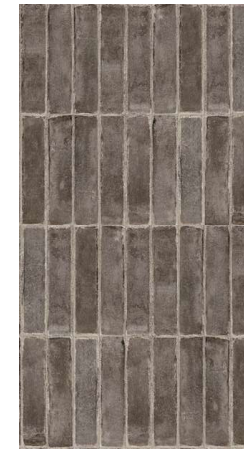
Bit Moka Mat CSAB1M005