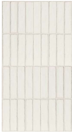
Bit White Mat CSAB1W005