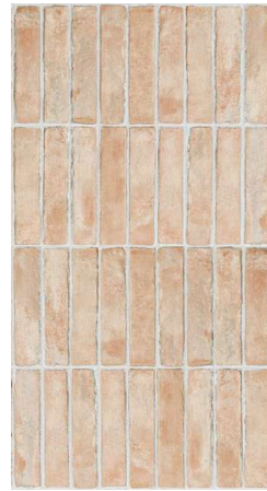
Bit Sand Mat CSAB1S005