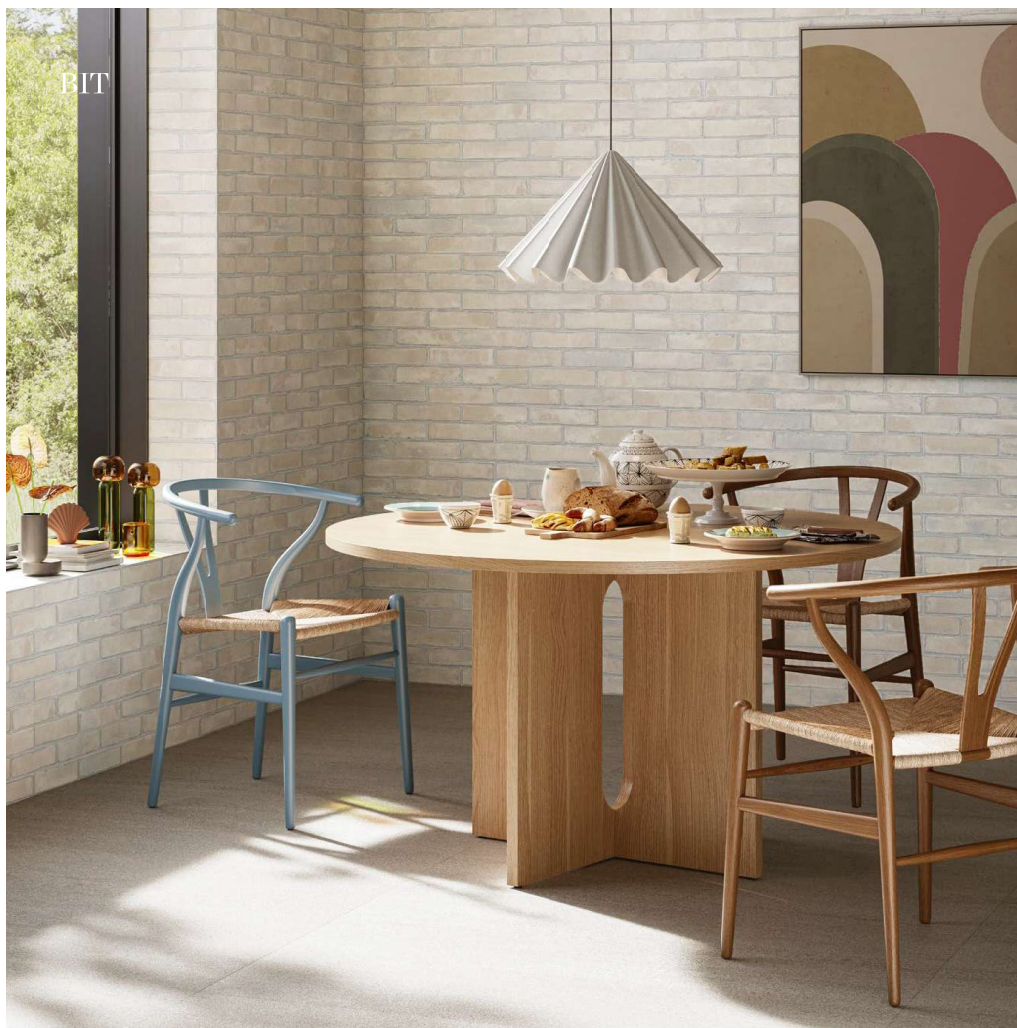
Wall / Bit Cream Mat Floor / Windstone Grey 60120 (WINDSTONE Collection)

The terracotta brick is re-proposed in a more graceful and, above all, ground form, allowing for a wide variety of installations. Horizontal, vertical, staggered, linear or herringbone, the laying pattern becomes an expression of a free compositional choice .