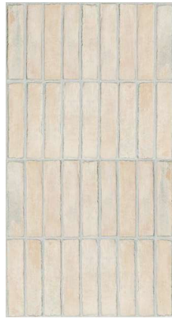
Bit Cream Mat CSAB1C005