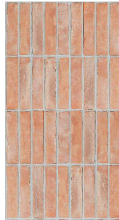
Bit Natural Mat CSAB1N005