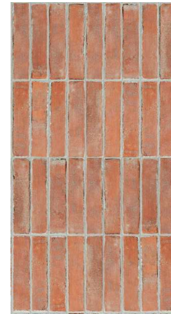
Bit Cotto Mat CSAB1C005