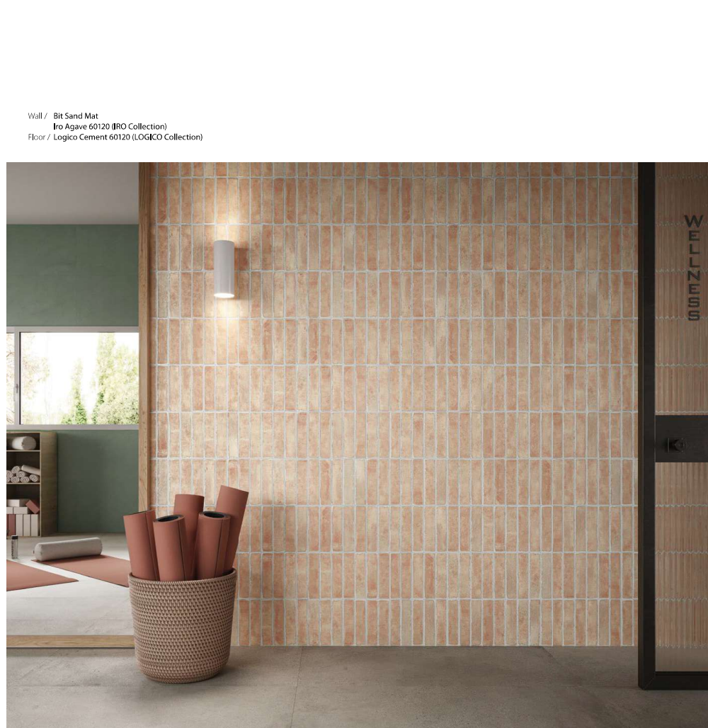
Wall / Bit Sand Mat Iro Agave 60120 (IRO Collection) Floor / Logico Cement 60120 (LOGICO Collection)

The terracotta brick is re-proposed in a more graceful and, above all, ground form, allowing for a wide variety of installations. Horizontal, vertical, staggered, linear or herringbone, the laying pattern becomes an expression of a free compositional choice .